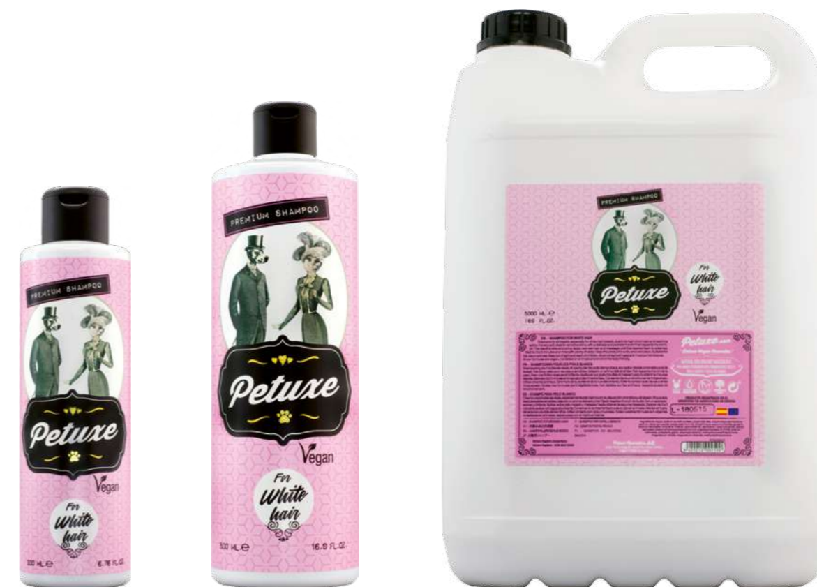
00220 · 200 ml