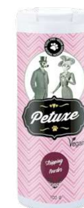
00901 · 100 g