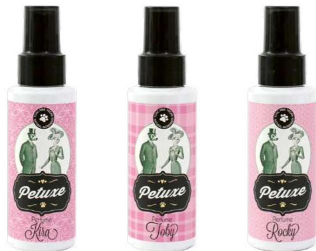
00243 · 100 ml 00244 · 100 ml 00245 · 100 ml

Sus características principales son varias: veganos, toxic free y de origen natural.