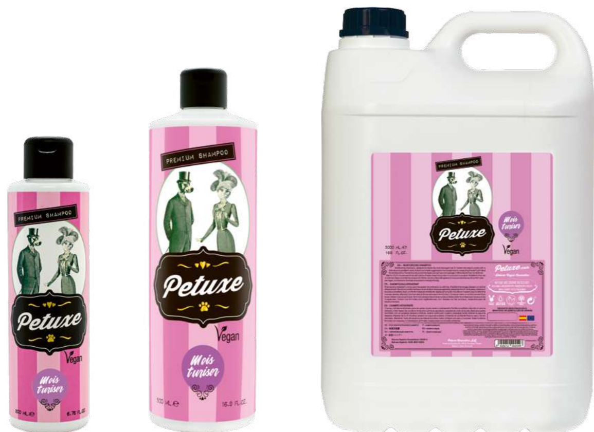
00226 · 200 ml