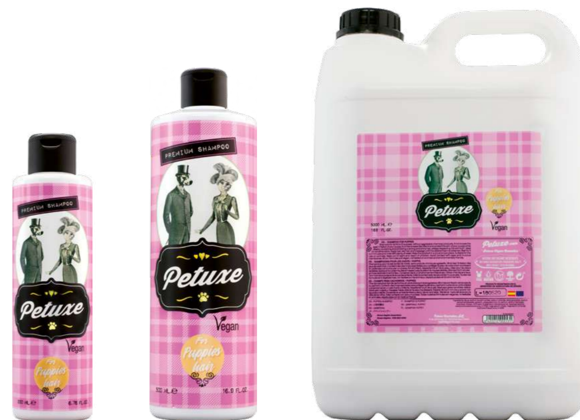
00223 · 200 ml