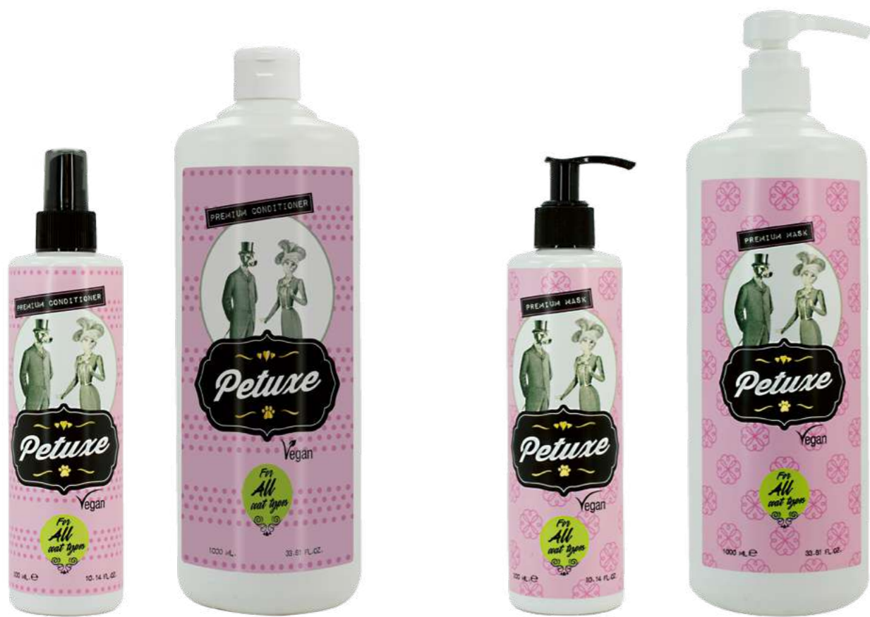
00263 · 300 ml