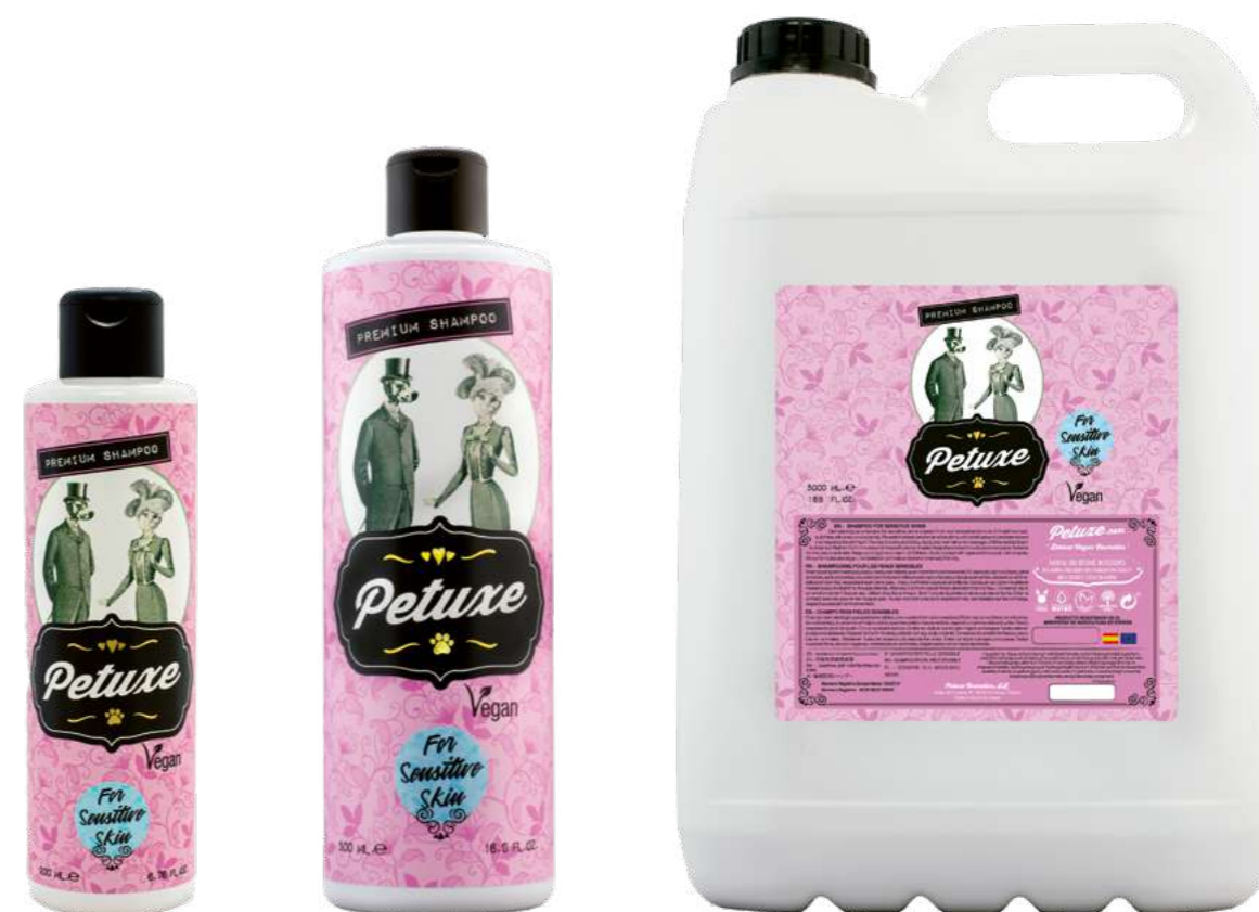
00225 · 200 ml