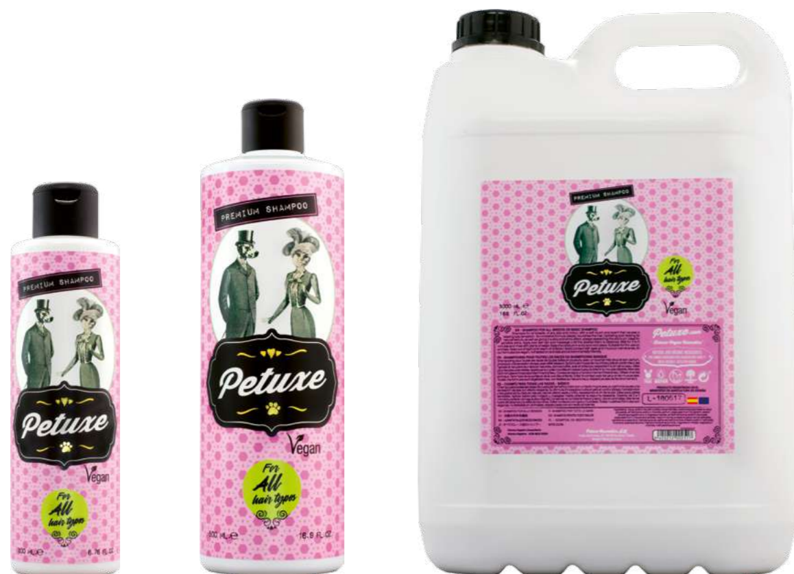
00221 · 200 ml