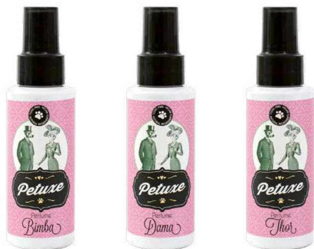
00240 · 100 ml 00241 · 100 ml 00242 · 100 ml