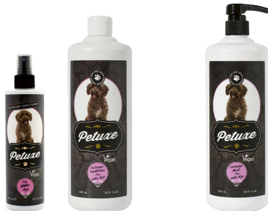
00264 · 200 ml