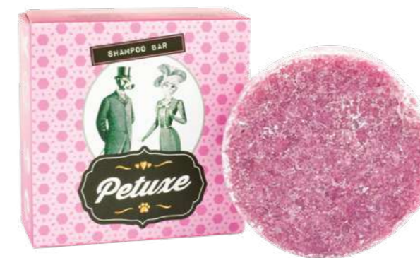
00269 · 50 g