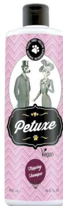
00239 · 500 ml