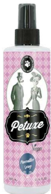
00900 · 300 ml