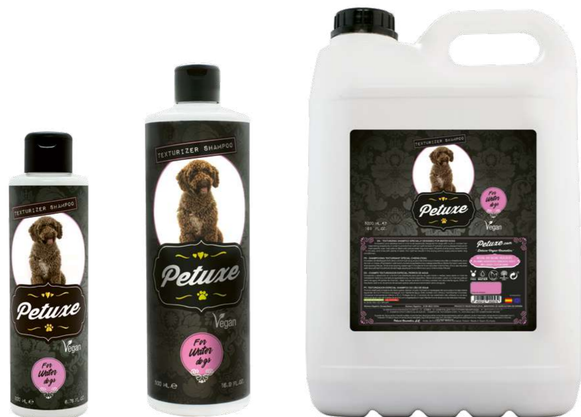
00227 · 200 ml