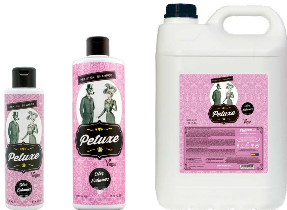
00222 · 200 ml