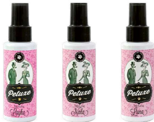
00246 · 100 ml 00247 · 100 ml 00248 · 100 ml

Sus características principales son varias: veganos, toxic free y de origen natural.